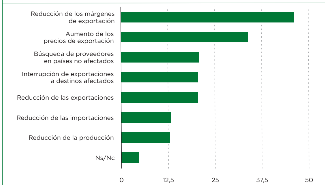
GRÁFICO 2. PORCENTAJE DE EMPRESAS EXPORTADORAS QUE IDENTIFICAN DISTINTAS CONSECUENCIAS DE LAS DIFICULTADES PARA TRANSITAR POR EL MAR ROJO